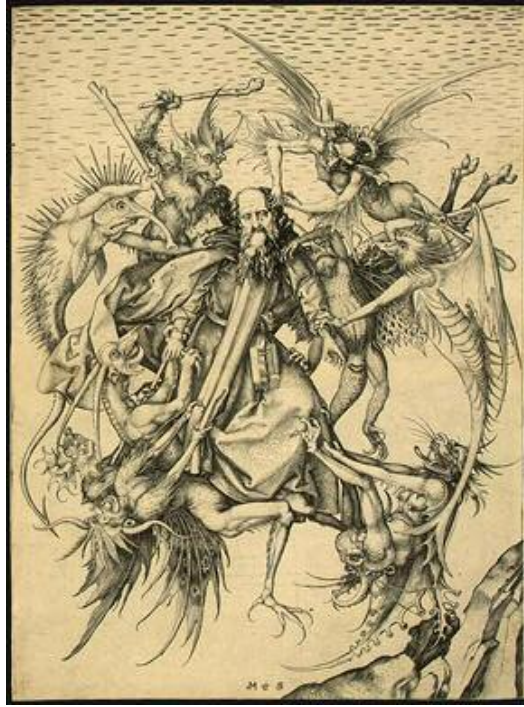
مارتن شونجاور Martin Schongauer

هونه‌ری ئه‌وروی سه‌ده‌گانی ناوه‌پاست و پینسانس ۲۶۵